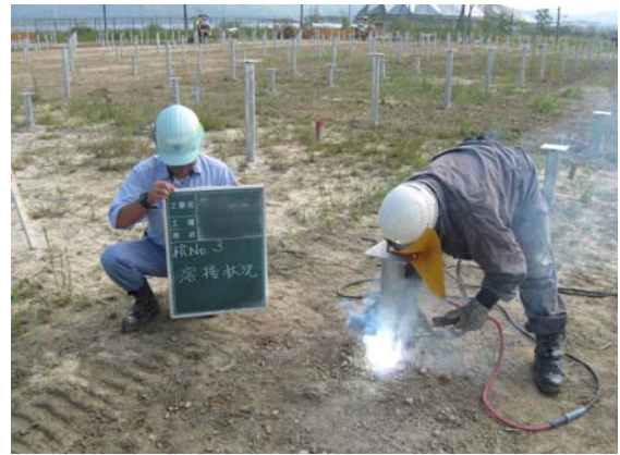
⑤ 下杭・上杭溶接工(継手施工)